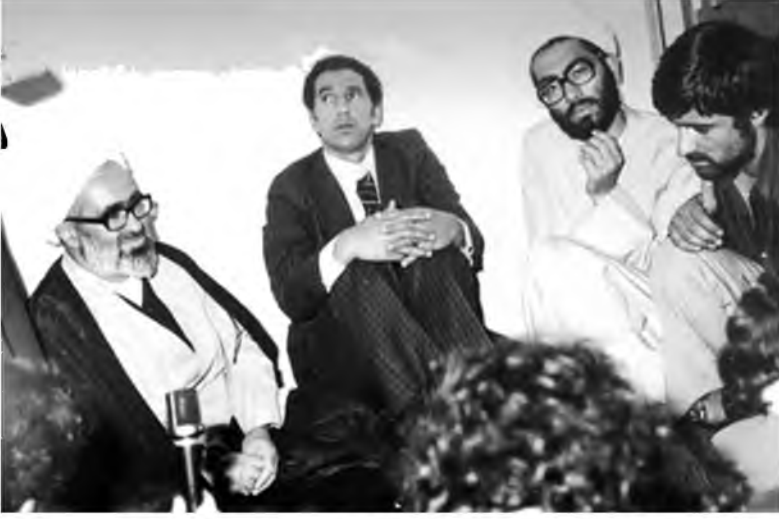
جانب من زيارة عبد السلام جلود لإيران بعد الثورة الإيرانية، 1979.